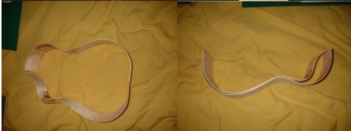
4. Zusammenleimen der Zargen. Vorne einen Block hin, und Hinten auch.